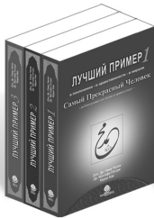
Лучший Пример - 1, 2, 3