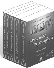
История Пророков - 1, 2, 3, 4, 5