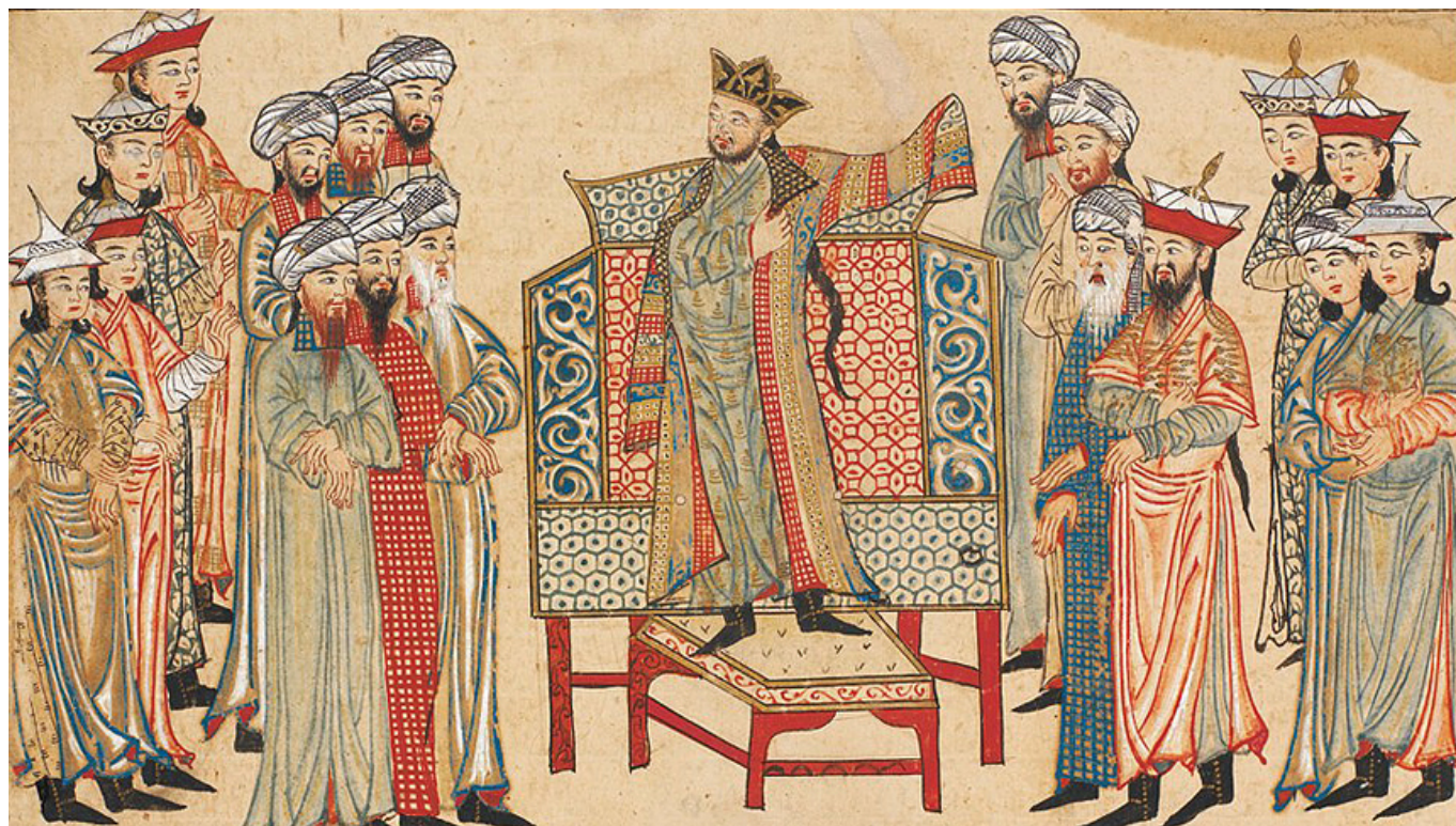
Султан Махмуд Газневи получает богато украшенные почётные одежды от халифа Аль-Кадира

Ибн Сина находит пристанище в Джурджане, где становится придворным лекарем. Именно здесь к нему присоединяется в качестве ученика Джузджани, который впоследствии станет его другом и допишет его автобиографию. Здесь же в Джурджане, Ибн Сина приступает к главному труду своей жизни – книге «Канон врачебной науки». Однако, вскоре, султан Махмуд узнает о местонахождении Ибн Сины и ученный на пороге своего 40-летия оказывается вынужденным переехать на запад Ирана в город Хамадан, который ранее был летней резиденцией парфянских царей.