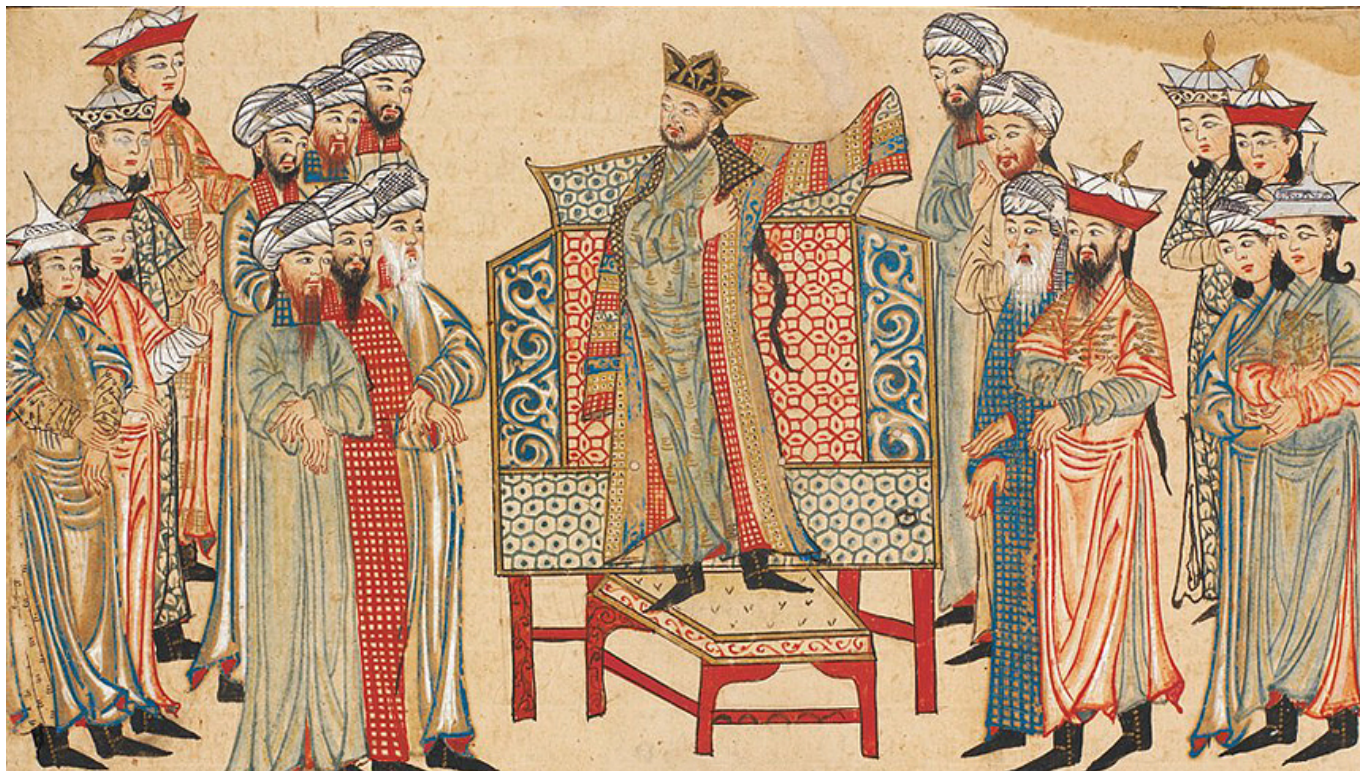
Султан Махмуд Газневи получает богато украшенные почётные одежды от халифа Аль-Кадира

Ибн Сина находит пристанище в Джурджане, где становится придворным лекарем. Именно здесь к нему присоединяется в качестве ученика Джузджани, который впоследствии станет его другом и допишет его автобиографию. Здесь же в Джурджане, Ибн Сина приступает к главному труду своей жизни – книге «Канон врачебной науки». Однако, вскоре, султан Махмуд узнает о местонахождении Ибн Сины и ученный на пороге своего 40-летия оказывается вынужденным переехать на запад Ирана в город Хамадан, который ранее был летней резиденцией парфянских царей.