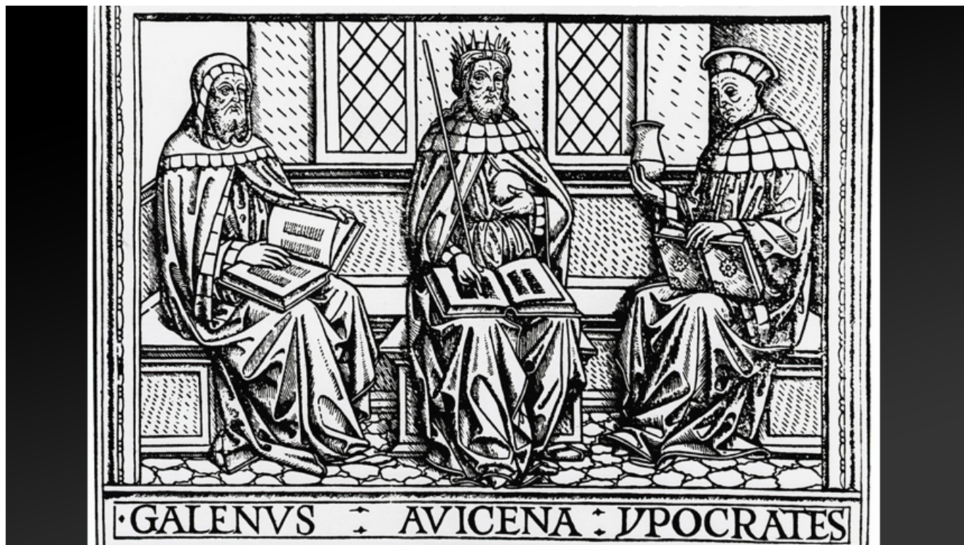
Ибн Сина с королевскими атрибутами в окружении Галена и Гиппократ

Ибн Сина (Абу Али Хусейн ибн Сина) известный на западе под именем Авицена - ученый-универсал, философ, врач, поэт, музыкант, духовный наставник, родился в 980 году в городе Афшан (недалеко от Бухары) в семье богатой и образованной. Увлекающийся наукой и философией отец Ибн Сины, по профессии сборщик налогов, через некоторое время, получает повышение в Бухару и вся семья переезжает в город, который, при Саманидах являлся средоточием высокой культуры и науки. Уже в возрасте 5 лет Ибн Сина проявляет тягу к обучению и обнаруживает исключительную память. В возрасте 10 лет он становится хафизом, т.е. знает наизусть весь Коран. Затем он изучает фикх, где является самым младшим из слушателей, однако, даже взрослые советуются с ним по вопросам исламского права, несмотря на его юный возраст (12 лет).