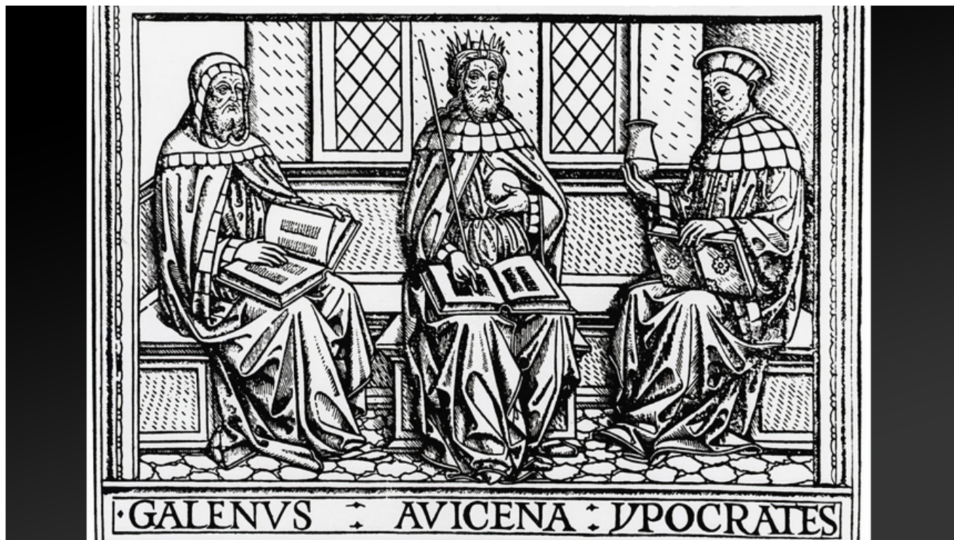
Ибн Сина с королевскими атрибутами в окружении Галена и Гиппократы

Ибн Сина (Абу Али Хусейн ибн Сина) известный на западе под именем Авицена - ученый-универсал, философ, врач, поэт, музыкант, духовный наставник, родился в 980 году в городе Афшан (недалеко от Бухары) в семье богатой и образованной. Увлекающийся наукой и философией отец Ибн Сины, по профессии сборщик налогов, через некоторое время, получает повышение в Бухару и вся семья переезжает в город, который, при Саманидах являлся средоточием высокой культуры и науки. Уже в возрасте 5 лет Ибн Сина проявляет тягу к обучению и обнаруживает исключительную память. В возрасте 10 лет он становится хафизом, т.е. знает наизусть весь Коран. Затем он изучает фикх, где является самым младшим из слушателей, однако, даже взрослые советуются с ним по вопросам исламского права, несмотря на его юный возраст (12 лет).