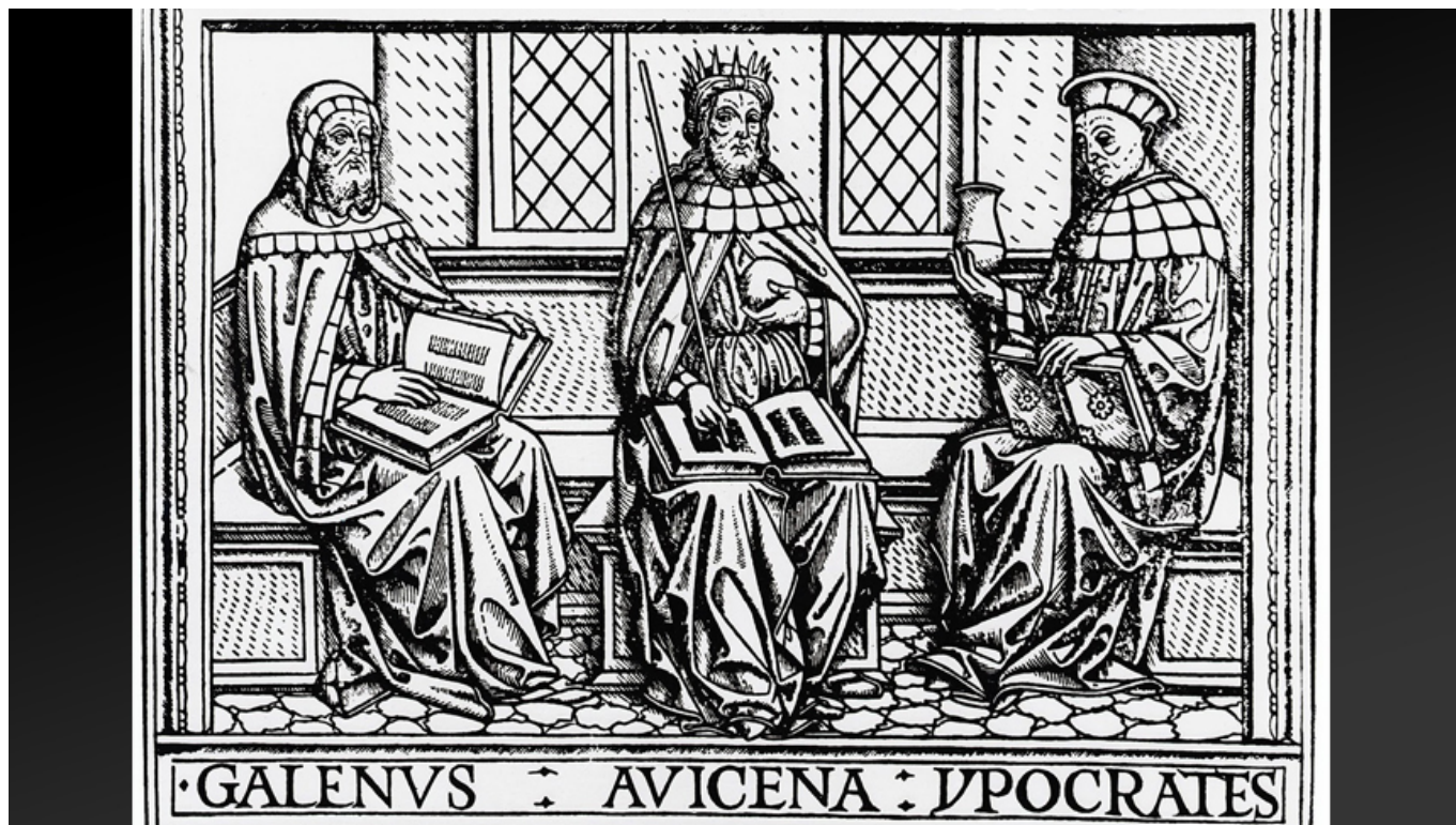
Ибн Сина с королевскими атрибутами в окружении Галена и Гиппократы

Ибн Сина (Абу Али Хусейн ибн Сина) известный на западе под именем Авицена - ученый-универсал, философ, врач, поэт, музыкант, духовный наставник, родился в 980 году в городе Афшан (недалеко от Бухары) в семье богатой и образованной. Увлекающийся наукой и философией отец Ибн Сины, по профессии сборщик налогов, через некоторое время, получает повышение в Бухару и вся семья переезжает в город, который, при Саманидах являлся средоточием высокой культуры и науки. Уже в возрасте 5 лет Ибн Сина проявляет тягу к обучению и обнаруживает исключительную память. В возрасте 10 лет он становится хафизом, т.е. знает наизусть весь Коран. Затем он изучает фикх, где является самым младшим из слушателей, однако, даже взрослые советуются с ним по вопросам исламского права, несмотря на его юный возраст (12 лет).