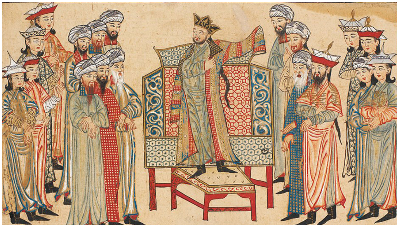
Султан Махмуд Газневи получает богато украшенные почётные одежды от халифа Аль-Кадира

Ибн Сина находит пристанище в Джурджане, где становится придворным лекарем. Именно здесь к нему присоединяется в качестве ученика Джузджани, который впоследствии станет его другом и допишет его автобиографию. Здесь же в Джурджане, Ибн Сина приступает к главному труду своей жизни – книге «Канон врачебной науки». Однако, вскоре, султан Махмуд узнает о местонахождении Ибн Сины и ученный на пороге своего 40-летия оказывается вынужденным переехать на запад Ирана в город Хамадан, который ранее был летней резиденцией парфянских царей.