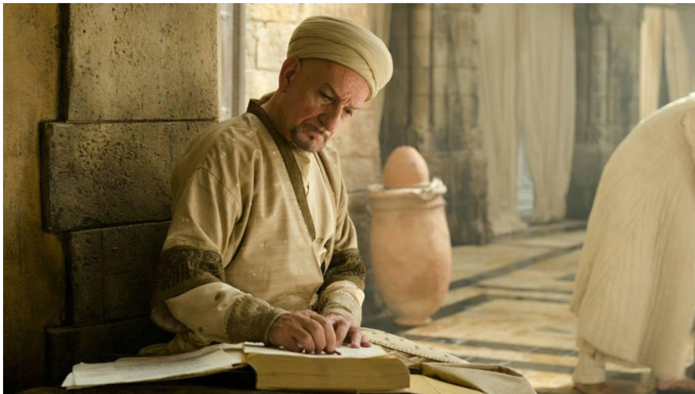
Ибн Сина в исполнении Бена Кингсли / Кадр из фильма «Лекарь. Ученик Авиценны»

Науки давались Ибн Сине легко до тех пор, пока он не познакомился с «Метафизикой» Аристотеля. Ибн Сина отмечает в своей автобиографии, что несмотря на неоднократное прочтение книги ему не удавалось понять её смысл. Система мироздания, какой ее видел Аристотель стала понятна Ибн Сине только после приобретения комментариев к "Метафизике" Аль-Фараби.