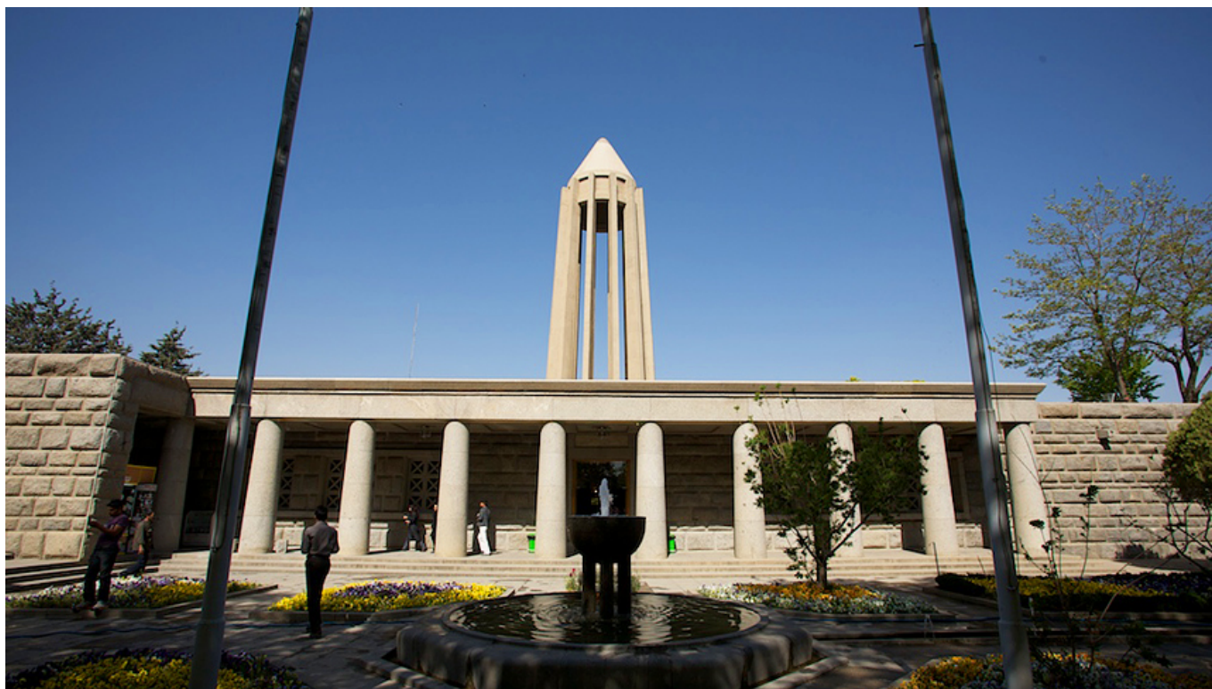
Мавзолей Авицены в Хамадане

Вскоре, эмир Хамадана умирает, его место занимает молодой наследник, находящийся под контролем казначея Таджа. В это же время, правитель соседнего Исфахана приглашает Ибн Сину перебраться к нему, что становится причиной для обвинения Ибн Сины в измене. В который раз великий ученный оказывается в заточении в крепости, в которой по воле Аллаха, уже через четыре месяца будут прятаться его тюремщики. Позорно проиграв кампанию против Исфахана, Тадж просит Ибн Сину ходатайствовать о мире, обещая взамен конец преследованиям и безбедную жизнь.