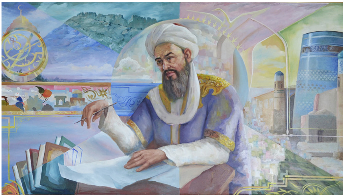
Хорезмшах Мамун II в вольном исполнении современных художников

В 1008 году размеренная жизнь Ибн Сины завершается. Это время могущественного врага Ибн Сины – султана Махмуда, выдающегося тюркского государственного деятеля и полководца при котором государство газневидов достигло расцвета. Султан Махмуд намеревался сделать столицу Газни – блестящим городом, равным Бухаре. С этой целью в город добровольно или насильно прибывали ремесленники, ученые, архитекторы.