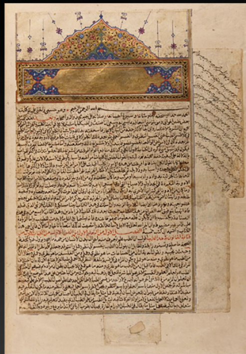
«Канон врачебной науки». Титульный лист. Венеция, 1544 г. и фрагмент "Канона" на арабском языке.

Именно в Исфахане Ибн Сина завершает свой знаменитый труд «Канон врачебной науки», который принесет Ибн Сине всемирную известность и титул «Князь врачей». Являя собой энциклопедический свод медицинских знаний и врачебного опыта. «Канон» состоит из 5 книг.