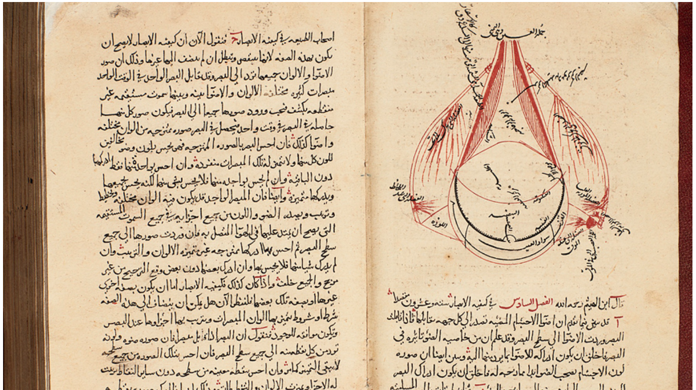
Разворот с иллюстрацией строения глаза из «Книги оптики» - выдающегося труда Аль-Хайсама

На 12 году заключения Аль-Хайсама халиф умирает. Ученого освобождают, а преемники прежнего халифа оказывают ему почтение, и он начинает с удвоенной силой шлифовать и дорабатывать свои идеи. Его фундаментальный труд «О свете и зрении» становится предвосхищением всей современной оптической науки. Свет преобразованный и направляемый математическими правилами и законами покидает сферу абстракции и вступает в сферу реальности. Аль-Хайсам становится «отцом современной оптики».