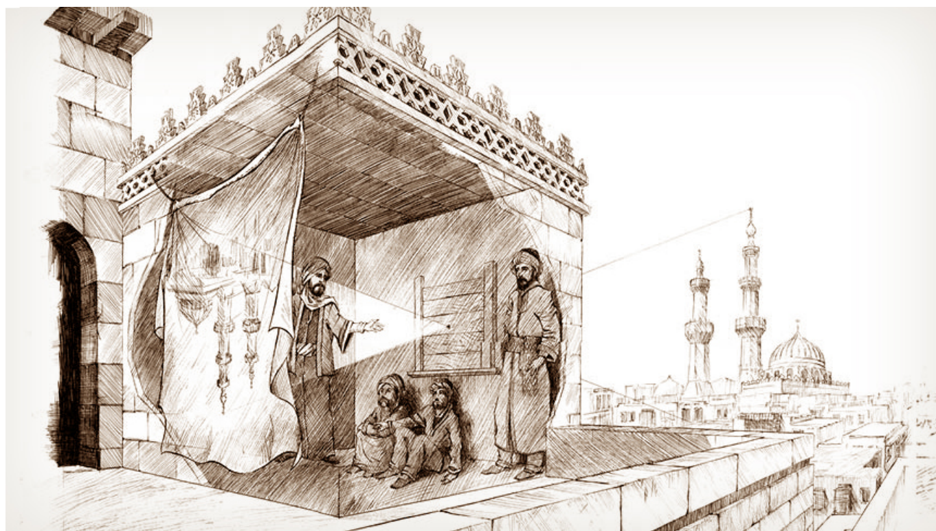
Аль-Хайсам первым объяснил принцип действия камеры-обскуры

Некоторые «ученые» Европы не стеснялись копировать труды Аль-Хайсама как собственные. Так в 1275 году в свет вышла книга оптики «Perspectiva» под авторством Эразма Витело. Однако, ученое сообщество не оценило его усилия по плагиату и нарекло его обидным прозвищем «обезьяна Альхазена».